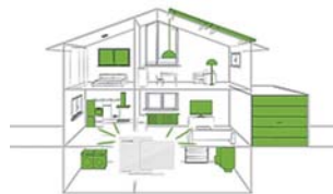
QIVICON Home Base使用イメージ

・QIVICON、QIVICON Home Base は、Deutsche Telekom AG の商標です。