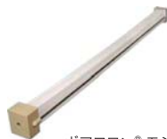
ポリアロン®モジュール