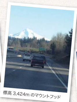
標高 3,424m のマウントフッド