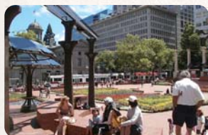
ポートランドのダウンタウン