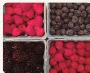
摘みたてのベリー

またファーマーズマーケットが週末ごとにいろいろな場所で開かれ、特産物として有名なベリーをはじめとする果物や、新鮮な野菜を買うことができます。ベリーは郊外の農園で手軽に摘むこともできます。家族とベリー摘みに出かけてみましたが、味もおいしくオレゴンの夏の週末を楽しみました。