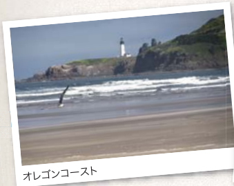
オレゴンコースト

また産業も盛んで、みなさんもご存知のナイキ、コロンビアスポーツといった大企業の本拠地もあります。SESMIの近くにインテルや日系企業もふくめた半導体関連企業が多数あり、「シリコンフォレスト」とよばれてハイテク産業地域として、街も活気にあふれています。