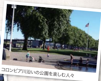
コロンビア川沿いの公園を楽しむ人々