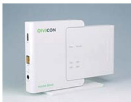
QIVICON Home Base

当社は、日本やアジア各国の通信キャリアを中心にブロードバンド関連製品の豊富な納入実績を有しています。今後も、スマートホーム市場の拡大が想定される海外市場で本格的に販売を拡大、家電製品をインターネットに接続し各種サービスの利用により、省エネ、快適な暮らしの実現に貢献していきます。