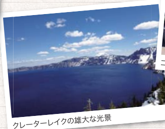
クレーターレイクの雄大な光景