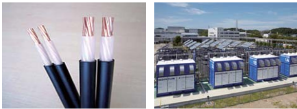
太陽光発電設備用直流1500V PVケーブル レドックスフロー電池