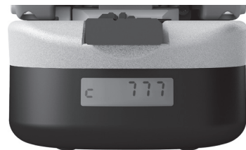
写真2 切断回数カウンタ

FC-8Rの主な製品仕様を表1に示す。従来機種FC-7Rで好評を得ている各種機能を踏襲し、更なる使いやすさを実現するべく、①切断回数カウンタの搭載、②開閉角度切り替え機構、③切断刃の回転動作切り替え機構、④ファイバ屑回収箱の大容量化、⑤軽量化、を実現した。